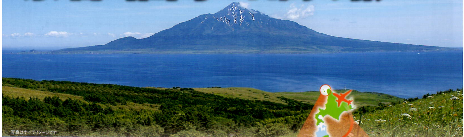
写真はすべてイメージです