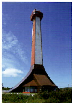
稚内市開基百年記念塔・北方記念館