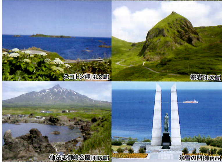
スコトシ岬【礼文島】