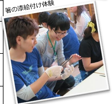
↑ちょっとしたコツを安代の名人から 教えてもらうチャンス! (イメージ)