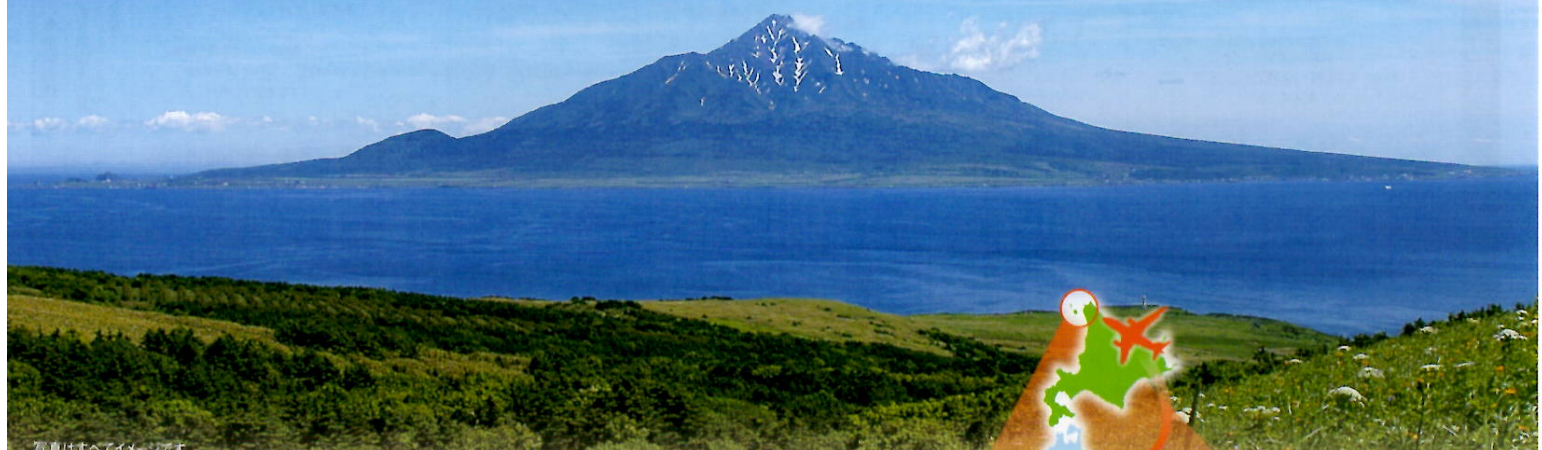
写真はすべてイメージです

日本三大湿原のひとつ「サロベツ湿原」と 日本最北端の村・天然ホタテ日本一の 「猿払村」も訪ねる。