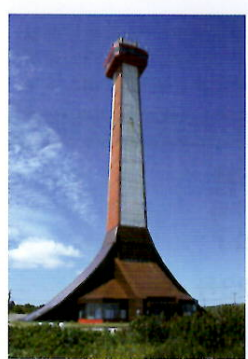
稚内市開基百年記念塔・北方記念館