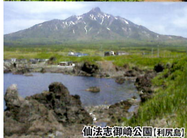
仙法志御崎公園(利尻島)