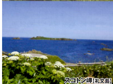
スコトシ岬(利文島)