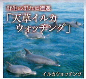
イルカウォッチング

「長崎と天草の潜伏キリシタン遺産」は、日本におけるキリシタン教の伝来と繁栄、激しい弾圧と潜伏、そして奇跡の復活を歩む歴史の中で、日本でキリシタン教が禁じられた17~19世紀に、長崎と熊本天草地方でひそかに信仰を続けた「潜伏キリシタン」の文化的伝統を物語る遺産が世界に認められたものです。ツアーは、江戸幕府が禁教政策の強化と「潜伏キリシタン」のきかけとなった「島原・天草一揆」の戦場、「原城跡」や身重となった「崎津集落」、宣教師と接触という「潜伏」が終わるきっかけとなる「信徒発見」の場所「大浦天主堂」にご案内します。天草島の「天草パールライン」や「天草西海岸サンセットライン」に沿ってドライブすると、美しい景観に思わず沈黙。教会めぐり、海の幸グルメ、遭遇率は100%イルカウォッチングなどで満喫しましょう。