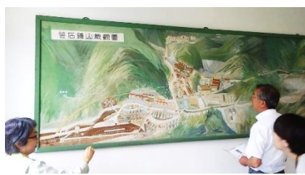
旧釜石鉱山事務所