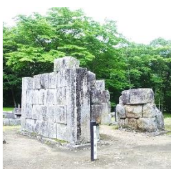
世界遺産 橋野高炉跡