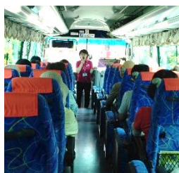
バス車内での解説

*お客様へ 個人情報の取扱について 当社は旅行申込みの際にお申込み書にご記入いただいたお客様の個人情報(氏名・住所・電話番号など)について、お客様との連絡、お申込みいただいたご旅行における運送・宿泊機関等の提供するサービス手配の為の手続きに必要な範囲で利用させていただきます。*バス乗車中はシートベルト着用をお願いいたします。*掲載の写真はすべてイメージです。