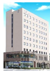
釜石ベイシティホテル 昼食会場

【講座企画協力】 (公財)盛岡市文化振興事業団 盛岡市先人記念館 * 講座内容問合わせ TEL019-659-3338