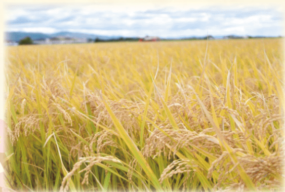
実りの季節の様子