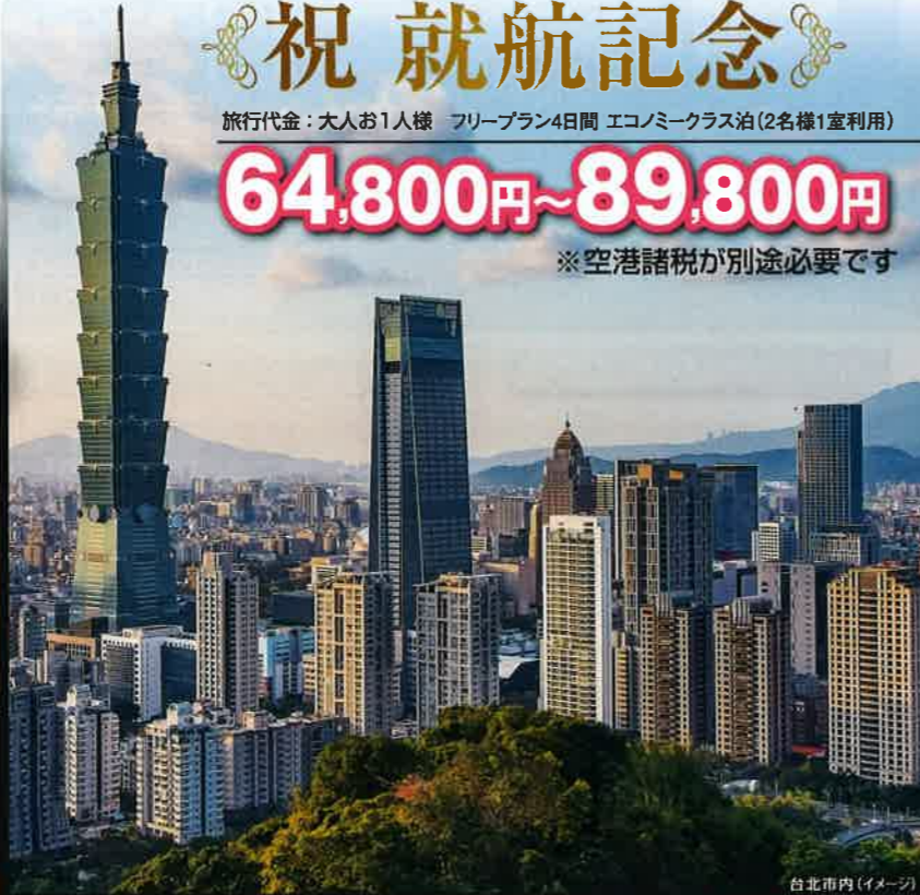
台北市内(イメージ)