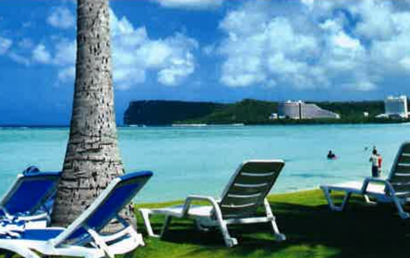
※写真はすべてイメージです

利用ホテルについて ●バスタブなしのお部屋になる場合がございます。※3名1室利用ができない場合がございます。※ベッドタイプの確約はできません。