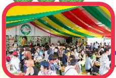
⑤収穫祭 (予約席あり)

遠野発16:30 == 道の駅 遠野風の丘 (お買い物&休憩) == 18:15頃 盛岡駅西口 着