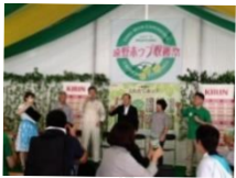
遠野ホップ収穫祭!