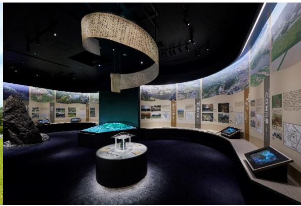
平泉世界遺産ガイダンスセンター