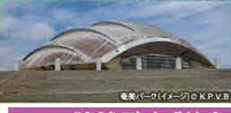
2日 諸鈍デイゴ並木

加計呂麻島にあるデイゴの巨木群 諸鈍長浜の海沿いに続く諸鈍デイゴ並木は、樹齢300年以上というみごとな巨木群です。の並木の一角に映画「男はつらいよ」のロケに使われた家があり、記念石碑もあります。