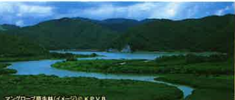
2日 奄美大島世界遺産センター

2日 マングローブ展望台 「住用マングローブ林」は、国内では2番目の大きさを誇るマングローブ原生林。そのマングローブ原生林を上から一望できる展望台です。