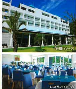
レストラン(イメージ)