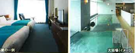
お部屋の一例 大浴場(イメージ)

奄美の心やすらぐターコイズブルーの海を目の前に南国ならではのゆっくりとした時の流れをお楽しみください 名瀬港近くの小島にあるスパ付きのリゾートホテルです。繁華街まで約10分の距離にありながら、奄美の豊かな自然を満喫できます。全室リクライニングチェアを完備。客室のタオル類は今治タオルを使用しています。大浴場からは海が見え、昼間には名瀬の街を見下ろす絶景、そして夜は夜景も楽しみ、一日中癒される空間です。