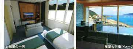
お部屋の一例 展望大浴場(イメージ)

奄美市名瀬街地で42年間営業してきました奄美サンパザホテルから、名称新たに「ホテルサンデイズ奄美」として市街地の名瀬マリンタウンに新築オープン。奄美群島最大の室数と名瀬湾を一望できるサウナ付き大浴場を用意。レストラン「愛かな」では本格的な奄美郷土料理の鶏飯や塩豚などをお楽しみいただけます。