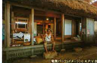
奄美パーク(イメージ)

奄美の美しい自然や多様な文化・歴史を紹介する施設です。奄美の自然を描き続けた日本画家・田中一村の作品を紹介する「田中一村記念美術館」もあります。