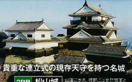
貴重な連立式の現存天守を持つ名城