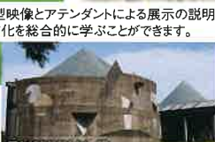
屋久杉自然館(イメージ)