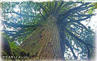
ヤクスギ(イメージ)