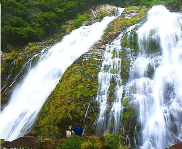
大川の滝(イメージ)