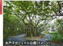
志戸子ガジュマル公園(イメージ)

樹齢500年以上といわれる 巨大なガジュマル 樹齢500年以上といわれる巨大なガジュマルをはじめ、亜熱帯の植物が多く見られる屋久島最大のガジュマル公園です。