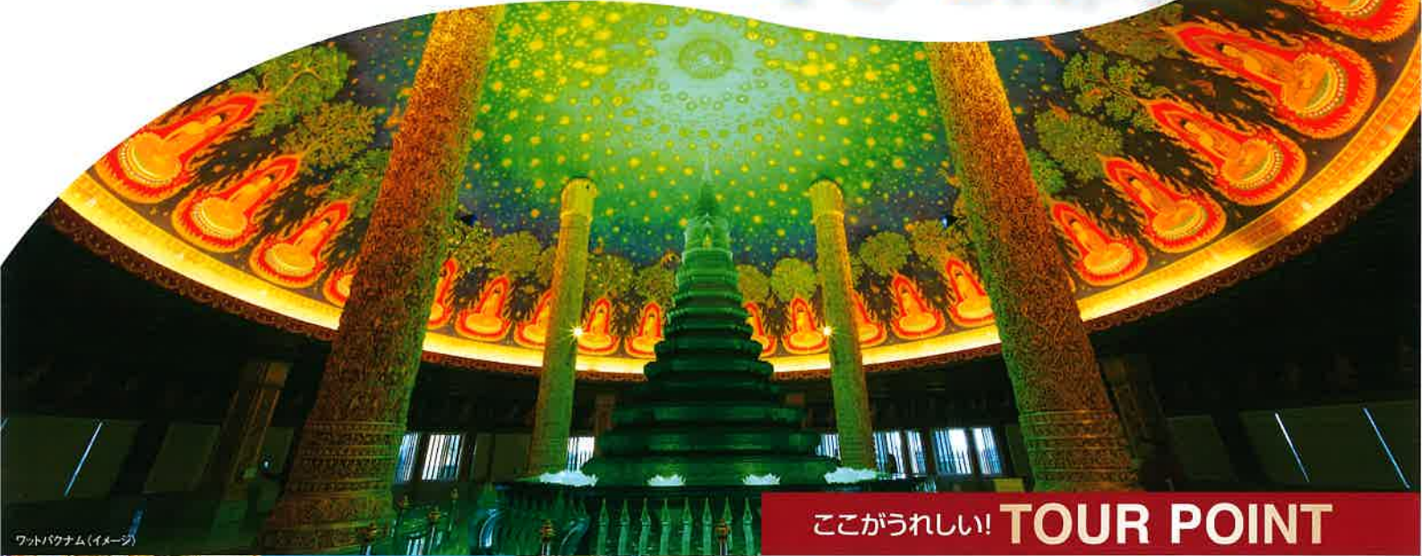
ワットパナム(イメージ)