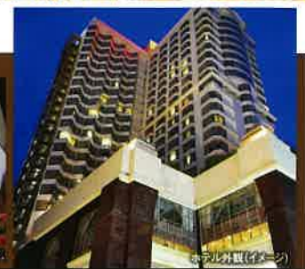
ホテル外観 (イメージ)