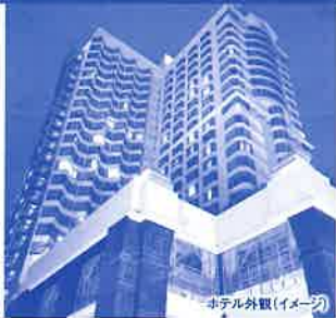
ホテル外観(イメージ)

ナイトバザールまで徒歩1分の全500室の大型ホテル。お部屋は36㎡~の広めのつくりで、全室バス・トイレ付。タイ北部の伝統様式風かつモダンな色を基調としたシンプルで落ち着いた雰囲気です。5つのバー&レストランをはじめプール、フィットネス、スパ、ショッピングアーケードなどを備えます。