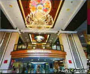
ホテル内 (イメージ)