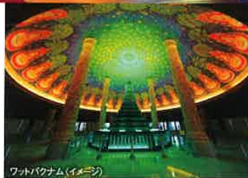
ワットパナム(イメージ)