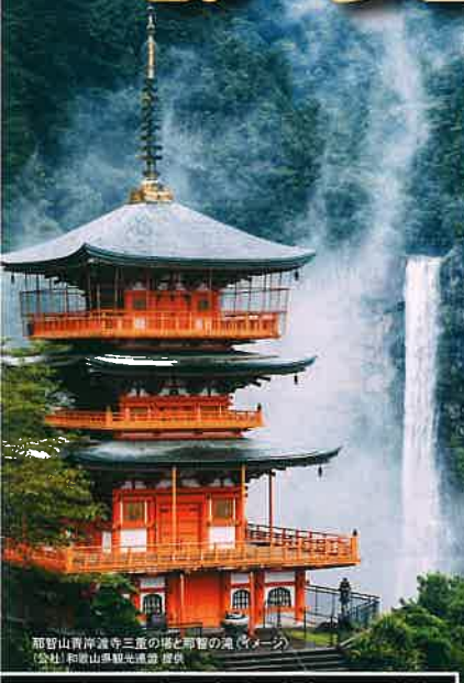
那智山青岸渡寺三重の塔と那智の滝 (イメージ) 〔会社〕和歌山県観光推進課 提供