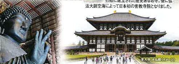
高さ約49.1mの大仏を収める 奈良を代表する世界遺産