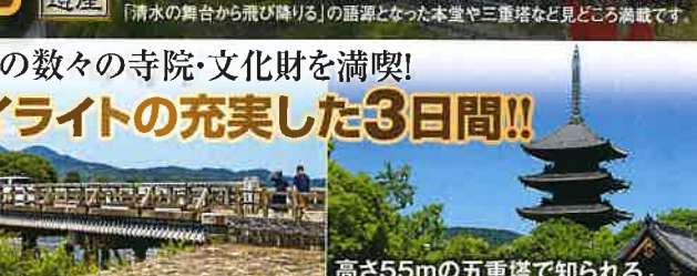
高さ55mの五重塔で知られる 世界遺産 2日目 東寺 東寺は、いまから1200年前の平安遷都の際に建立された歴史あるお寺。後に弘法大師空海によって日本初の密教寺院となりました。