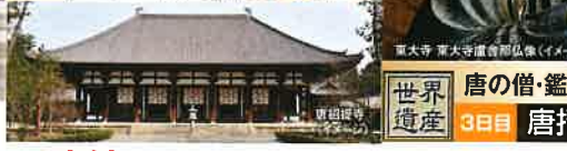
世界遺産 3日目 唐招提寺 唐の僧・鑑真和上が創建