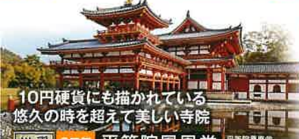
10円硬貨にも描かれている 悠久の時を超えて美しい寺院 世界遺産 2日目 平等院鳳凰堂 藤原氏ゆかりの「平等院」は平安京の優雅な趣感じられる世界遺産です。