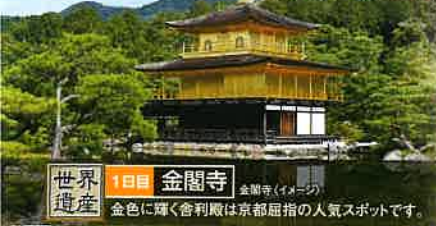
世界遺産 1日目 金閣寺 金色に輝く舎利殿は京都屈指の人気スポットです。

世界遺産の古都 京都・奈良 の数々の寺院・文化財を満喫! すべてがハイライトの充実した 3日間!!