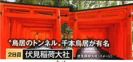
鳥居のトンネル、千本鳥居が有名 2日目 伏見稲荷大社 伏見稲荷大社(イメージ)