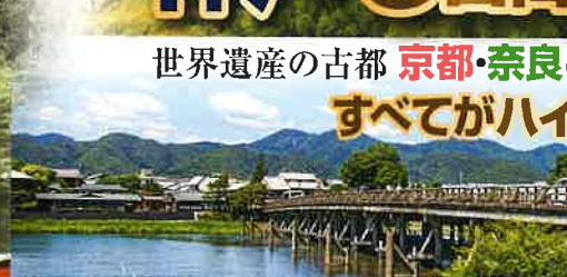
四季折々で美しい景色を堪能できる 1日目 嵐山 渡月橋 平安時代の貴族たちにも好まれた風光明媚な嵐山は、シンボルともいえる渡月橋周辺に、由緒あるお寺や神社が点在します。季節が変わるたび何度でも訪れたいエリアです。