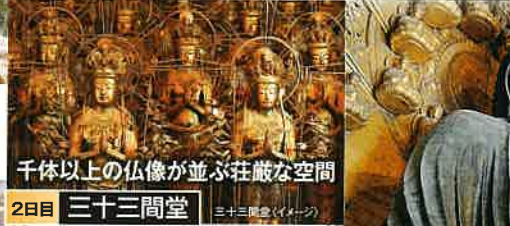
千体以上の仏像が並ぶ荘厳な空間 2日目 三十三間堂 三十三間堂(イメージ)