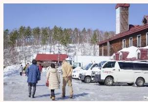
町の基幹産業 岩手くずまきワイナリーへ