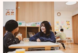
子育て環境やお仕事の紹介