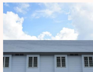
ふれあい宿舎グリーンテージに滞在